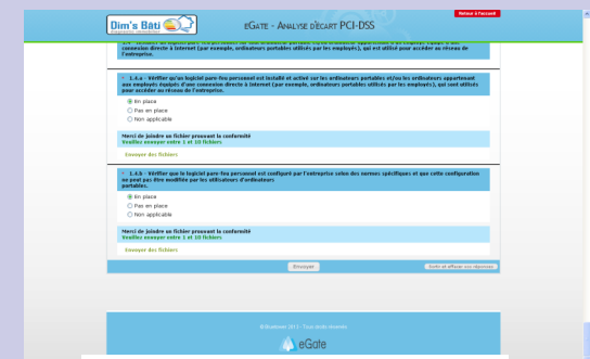
Ecran de fin d'un questionnaire