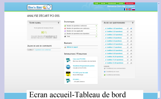
Ecran accueil-Tableau de bord